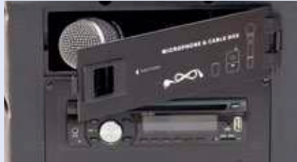
Staufach für Mikrofone und Fernbedienung