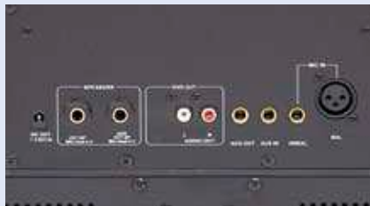
Viele Anschlüsse für externe Geräte, wie z. B. Lautsprecher